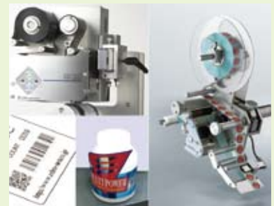
サーマルプリンタと印字例(左)とラベリングマシンと貼付例(右)

食品や医薬品などの賞味期限や使用期限の日付、原材料・成分等の情報が見やすく正確に表示されていることは、消費者および製造者のニーズです。また、数ある製品を識別するためのデザイン表示も重要です。当社では、サーマルプリンタ、印字検査機、ラベリングマシン等を提供しています。サーマルプリンタはパン・菓子・医薬品等への日付・各種コード印字。各種包装機に対応し、卓上式もあります。ラベリングマシンは、デザートや惣菜等各種容器への上面・側面貼り、プラスチックボトル等の胴巻きなどに使用されます。印字、印字検査、ラベル貼付のことなら当社にお任せください。代理店も募集中です！