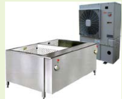
浮上装置付きの「ひやっ子」