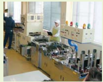
当社海苔製造ライン最新式遠赤外線海苔焼機