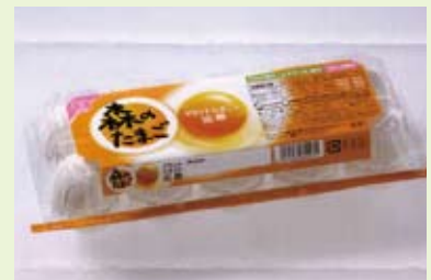
コクとうまみの「森のたまご」