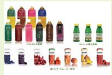
バラエティーに富む各種製品

また製品の販売だけでなく、原料提案から商品の研究開発・市場のニーズに合ったオリジナル商品の企画提案、そして顧客満足につながるマーケティング活動まで幅広くご提供します。小売、卸、フードサービス業、メーカーの方々とのマッチングを希望いたしております。