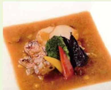
「スープカレー」盛り付け例