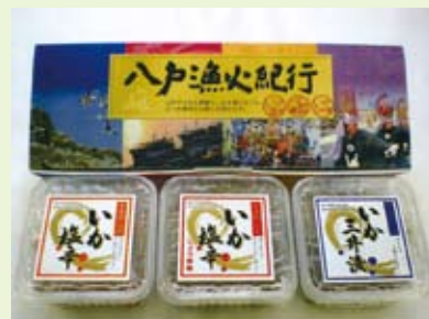
八戸で獲れたイカでつくった自慢の三品