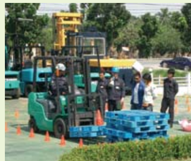
お客様への安全技能講習の風景

当社は創業以来15年にわたり、タイ国内で活躍する日系企業様向けにフォークリフトの販売・メンテナンス・レンタル等お客様のご要望に応じた物流システムのサポートを行っています。近年タイ国では現場での不測の事故も発生し、作業員の安全教育が急務になっています。そうした中、当社では独自の安全教育の一環として日本では義務付けられているフォークリフトの技能講習を他社に先駆け実施しています。作業員の安全を守るとともに、さらなる作業効率の向上にお役に立てるものと思います。タイ国に進出している企業様をはじめ、進出をご検討されている企業様とのマッチングを希望いたします。