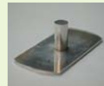
リチウムイオン電池関連部品