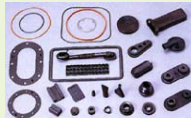
ゴム・樹脂製のパッキング、O-リング

当社は、パッキング、バルブ、ホース、樹脂部品など自動車部品の製造・販売・調達を行っています。タイ・上海の販売子会社、またタイ・中国・韓国・マレーシアの製造拠点の多数の協力会社との提携により、市場のグローバル化に伴う品質・コスト・納期の新たなニーズにも応えられるようアジアを中心として生産・販売・調達のネットワークづくりを進めてきました。本年度はタイにゴム部品の自社工場を設立、さらなる事業の拡大・強化を目指します。海外での主要自動車部品メーカーへの対応強化のため、現地でのゴム・樹脂部品の製造や金型調達に関する提携先を募集しています。