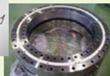
風力発電機用旋回ベアリング