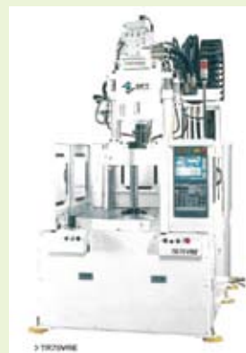
中国工場に導入する型成形機