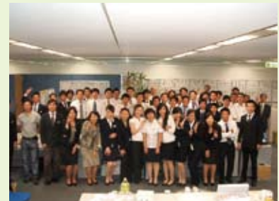
中国の若い技術者を派遣いたします！