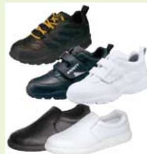
上からプロテクティブスニーカー「マジカルセーフティ」#630、#651、 厨房用シューズ「サーウィスト」#09