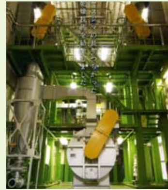
YKD型豆乳おから乾燥設備