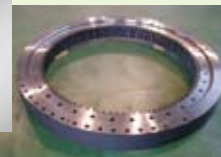
クレーン車用旋回ベアリング