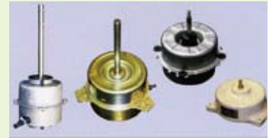
高性能・高効率・高制御性の直流駆動モーター（ブラシレスDCモーター）