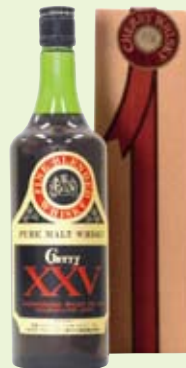
東北唯一の本格地ウイスキー、ピュアモルト「チェリーXXV」