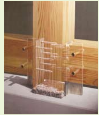
柱勝ち「新軸組構法」による 高耐震性構造