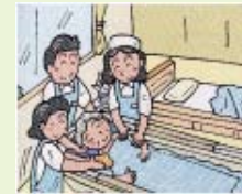
自宅ベッドの 脇で入浴を可 能にしました