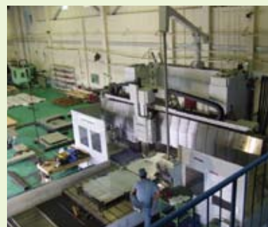
門型マシニングセンタ ユニバーサル ヘッド X-5,000 Y-3,250 Z-1,950