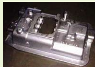
カバートランスミッションケース