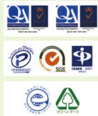
「セキュリティ対策・環境対策」に 厳しい基準で対応しています