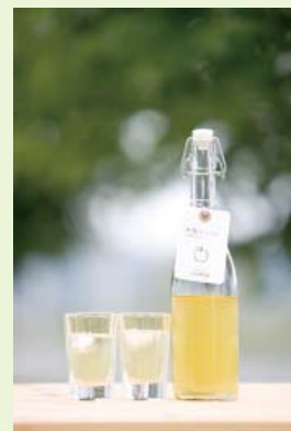
「ラベルタグ」 名前を書いてマイボトルに