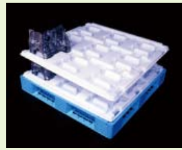
(上) 自動車部品搬送トレー (下) 液晶搬送トレー