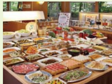
60種類のメニューが並ぶ ビュッフェダイニング