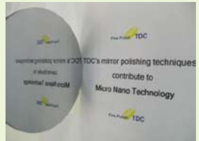
極限の面粗さ・平面度を追求した ステンレス基板