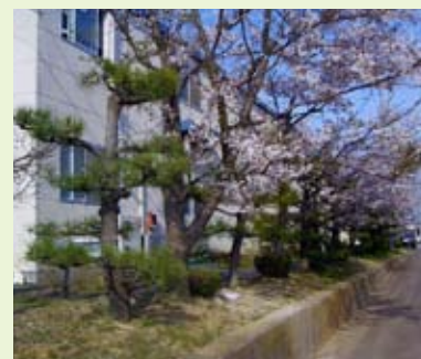
会社の歴史を刻む桜が満開の時の写真です