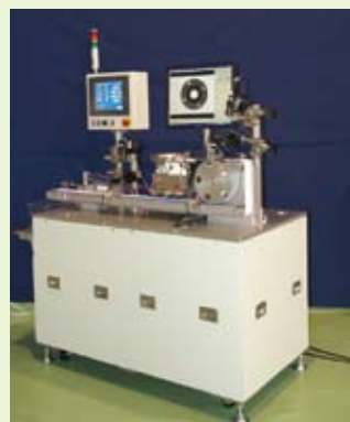
画像処理を用いた自動外観検査装置