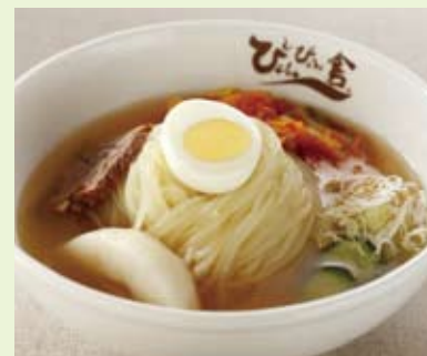
びよんびよん舎の盛岡冷麺