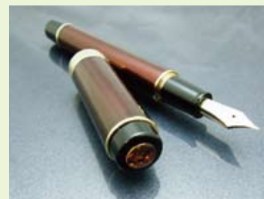
ペン先(大型)は 21 金で細字・中細・中字があります。販売価格 105,000 円(税込み)です