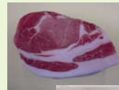
「うつくしまエゴマ豚」