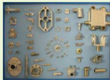
精密亜鉛ダイカスト製品群