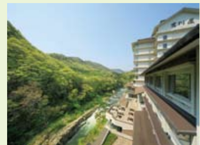
自然に囲まれた温泉で心身をリフレッシュ！