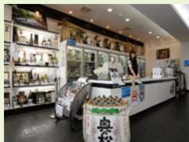
全商品が試飲できる酒蔵ギャラリー