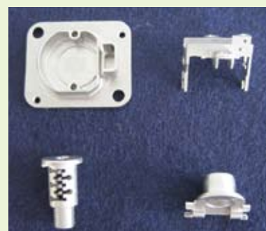
当社のダイカスト加工品