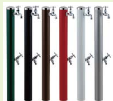
ウォーターポールシリーズ