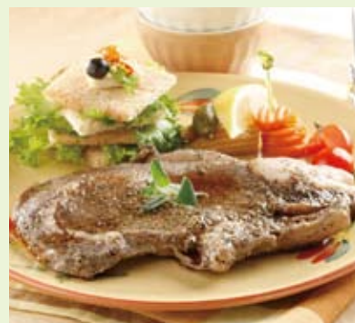
十勝若牛のリブロースト