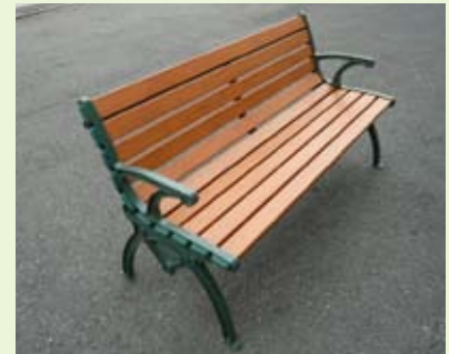
木調のカラーが落ち着いた 景観を演出する「デラックスベンチ」