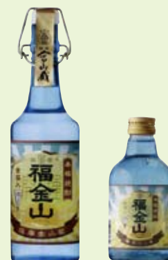
お祝いに最適な 金箔入り芋焼酎「福金山」