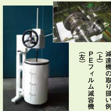
減速機の取り扱い例 (上) PEフィルム減容機 (左)