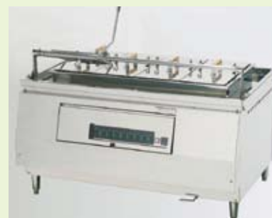
座席70席以上に対応。能力540玉/時の「おどり舞」