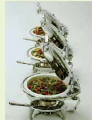
各種スマートチューファイニング

当社は平成2年の創業以来、成熟した食文化を持つヨーロッパを中心とした外食産業器材を日本の市場に提案してまいりました。近年の外食産業界の市場ニーズは、価格面ではグローバル化に伴う低価格時代に突入、その一方で新たな魅力的な素材の開発も進んでいます。そうしたニーズの変化に合わせ、現在の輸入先はアジア圏を含め12カ国になっています。当社は日本の食文化の向上に貢献していく会社でありたいと願っています。そのため、ブランドだけにこだわらず質の高い製品を、主にヨーロッパより輸入しております。外食産業の企業様とのマッチングを希望しています。