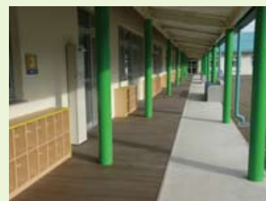
県内保育園の「リポスファーマニチャー」および「リポスデスク」の施工例