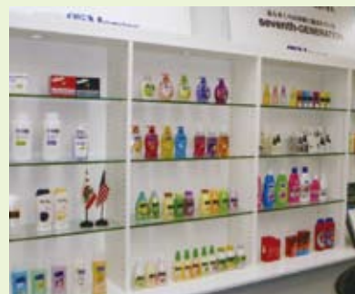
取扱商品を展示する本社ショールーム