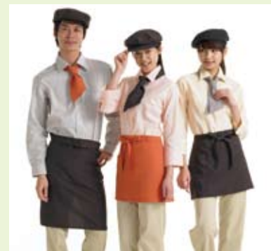
カタログユニフォームの例