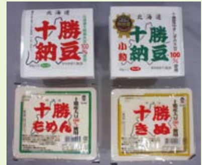
北海道産大豆を使った納豆と豆腐

北海道産大豆を原料とする納豆・豆腐は道内でも高い評価をいただいております。また道内の総合スーパーマーケットのPB商品の生産も担っています。現状は北海道全域の販売が主となっておりますが、今後は道外へも販売を拡大していきたいと考えております。特殊物流により関東・中京地区までは翌日配達が可能です。当社商品をお取り扱いいただける道外企業様とのマッチングを希望しております。