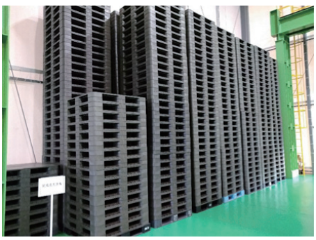
一般家庭から廃棄されるプラスチックを再利用 (搬送用パレット)