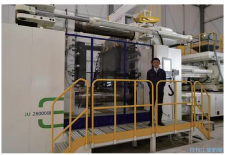
導入した中国海天社製射出成形機 (型締め力2800トン)