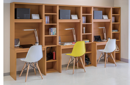
書類棚、壁面収納、デスクラックなど、設置場所に合わせサイズオーダー可能