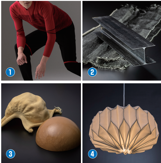
②③④は編地を硬化（2次加工）させたサンプルです。

当社が独自開発した、ホールガーメント横編機は、無縫製で立体的なニット製品を作ることができます。無縫製ならではの美しいシルエツトが表現でき、世界のアパレルブランドで採用されています。また、生産工程で裁断・縫製の必