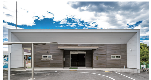
施工例：外装、保育園

応接室、店舗外装などなど、あなたの特別な空間創出にご活用ください。新たな抗菌シリーズもご用意して、お問い合わせお待ちしております。