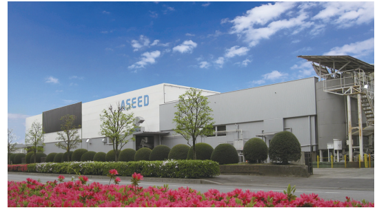
アシードブリュー(株)宇都宮飲料工場