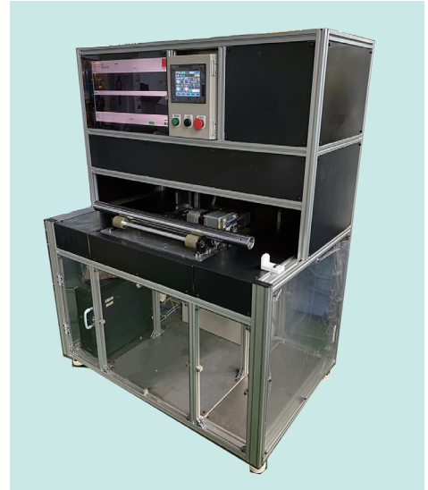
シャフト検査装置「HW1000」

これまでカメラで検出できなかったキズにお困りの方や、人が行う目視検査を機械化・自動化することをご検討の方は、ぜひお問い合わせください。