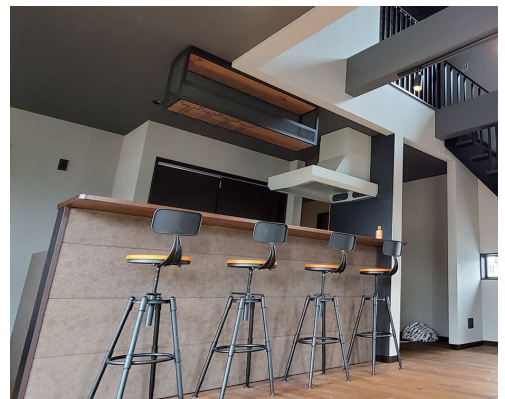
施工例：内装、バーカウンター