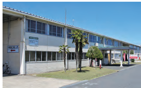
丹後織物工業組合の直営工場

織り上がったちりめんの、セリシン（たんぱく質の1種）や汚れを洗い落とす精練。この作業により糸が収縮して独特の風合いが生まれる