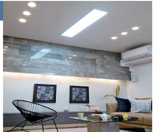
マンションにおける設置事例

また、UV ライトも内蔵され、照度を落としても光触媒の作用が継続します。この紫外線は光触媒が吸収するため、LED ライトから外部へ出射されるのを防止します。