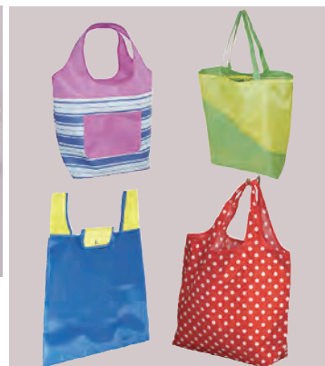
同社が製作するさまざまな縫製製品