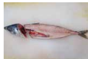
副産物（鯖の頭部と中骨）