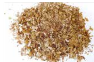
乾燥污泥（左：全体、右：拡大）