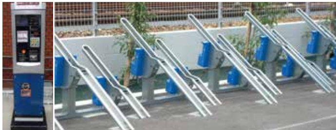
新製品「電磁ロック式ラック DKR-9 型」(右)と課金式精算機(左)。DKR-9 型では、タイヤのサイズが大きい自転車や電動アシスト自転車もロックしやすくなりました

このコーナーのバックナンバーは、ホームページ https://www.shokoken.co.jp/ に随時掲載してまいります。