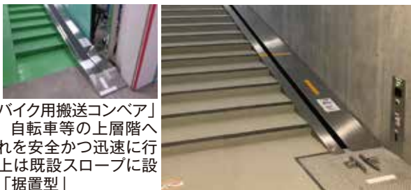
「自転車・バイク用搬送コンベア」(右)は、自転車等の上層階への乗り入れを安全かつ迅速に行えます。上は既設スロープに設置できる「据置型」