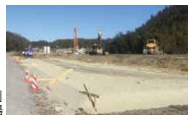
「サンドウエーブG」 施行現場