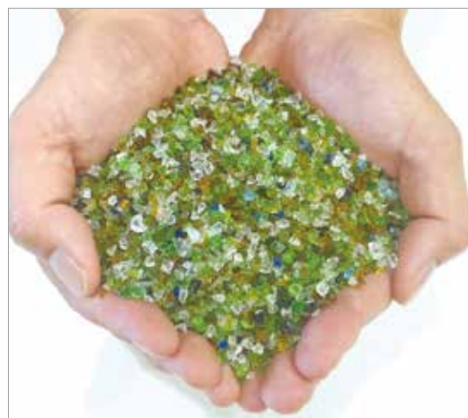
リサイクルガラス造粒砂「サンドウエーブG」

リサイクルガラス造粒砂「サンドウエーブG」（ガラス類）は、国土交通省の新技术情報提供システム（NETIS）に登録された技術で、「サンドウエーブC」（陶磁器類）とともに国土交通省の積算資料にも掲載されており、エコマーク商品としても認定され、土木資材として豊富な実績があります。