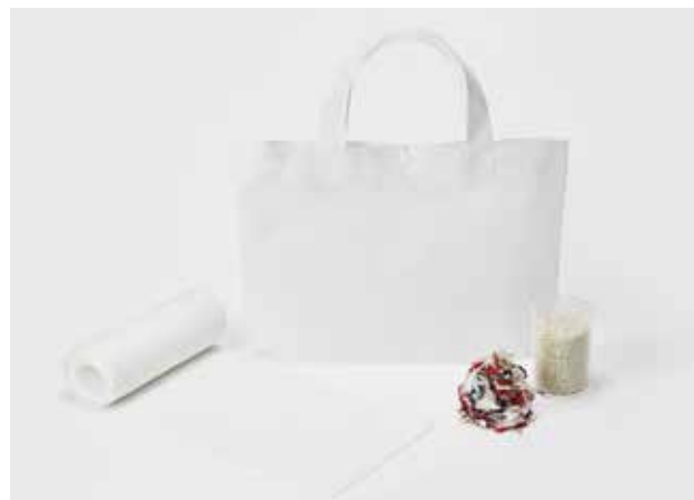
RETEXPET® (不織布) は、不要となった布類と廃棄PETボトルから作られた独自開発のサステナブルな素材。持ち帰り袋や内袋、フェイスカバーなどで活用されている