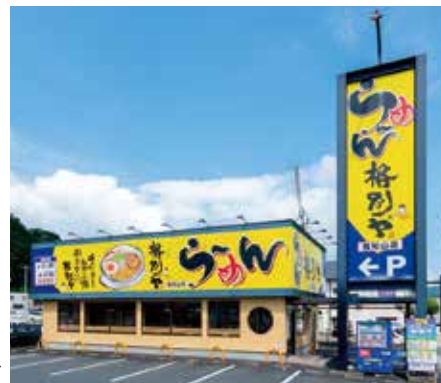
「ら〜めん格別ヤ」 福知山店