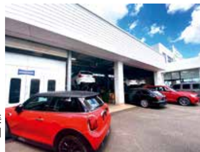
本社の認証工場には塗装ブースを完備。補修専用塗料「STANDOX」を使用