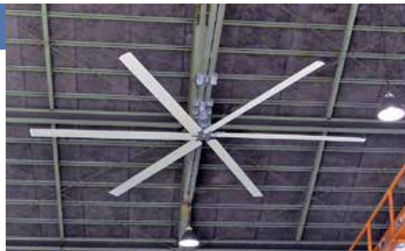
工場用大型天井ファン「流清」

弊社工場は6工場あり、部材から各部品を加工し、最終的には溶接組立しています。近年、板金事業、防水板事業、天井ファン事業と、いろいろな分野の仕事も増やしており、今後も社員が安定した生活ができ、社会にも末永く貢献できるように新しい製品を開発し、成長していく所存です。