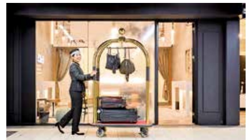
お荷物をカートに乗せて、客室までスタッフがご案内