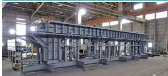
下水や雨水を流す管路をはじめ、さまざまな用途に使われるBOXカルバートの型枠