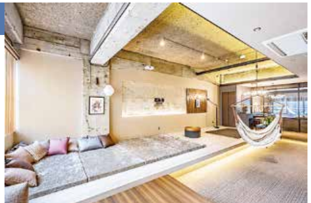
「ビル泊」の客室例。最大定員でのご利用であれば、1人1万円程度（時期により変動あり）で宿泊可能

客室は55㎡から99㎡のスイートルームを全7室ご用意。最大定員は広さに応じて4～8名ですので、ご家族やグループでもご宿泊可能です。滞在中は商店街のお店めぐりも楽しめますし、ケータリングなどを利用し室内でのんびり過ごすのもお勧めです。客室は、壁や天井の一部にビル感を残しつつ、プロジェクタースクリーン、ハンモック、屋上テラスなどの充実した設備を備えています。今までにない宿泊を、ぜひご体験ください。