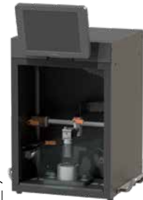
卓上型画像検査ユニット 「N-DesktopVision」