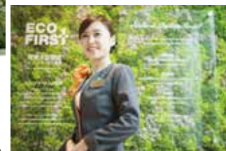
高品質なおもてなしを実現