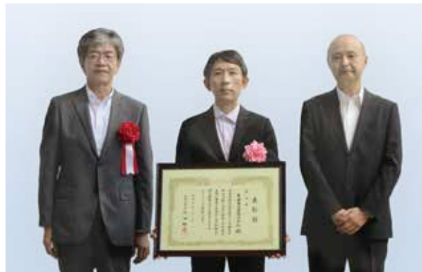
令和4年度「安全衛生に係る優良事業場、団体又は功労者に対する愛知労働局長表彰」奨励賞を受賞

当社の安全衛生活動の基本理念は「当社は労働災害のない、明るく働きやすい職場を構築する」とし、社員全員参加で日々安全衛生活動に取り組んでいます。