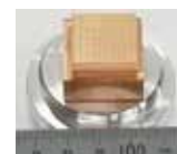
マイクロニードル