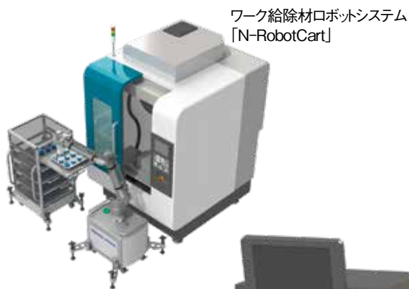
ワーク給除材ロボットシステム 「N-RobotCart」

卓上型画像検査ユニット「N-DesktopVision」は、「誤判定が減らない」「検査落ち対策がしたい」など、目視検査のお悩みを解決します。検査内容に合わせたオンリーワン画像処理システムを構築し、検査周辺の自動化設備の対応も可能です。サンプルワークの画像評価を無償で対応します。目視検査でお悩みの方は、ぜひ当社までご相談ください。