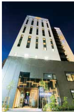
東京・池袋駅から徒歩5分 「スーパーホテル Premier池袋天然温泉」

2022年10月に「スーパーホテル Premier池袋天然温泉」が開業しました。JR・西武・地下鉄等の複数路線が交わる東京・池袋駅周辺で3店舗目になります。当店舗では、天然温泉「奥湯河原温泉」の源泉を直送しています。都会の喧騒を忘れてゆっくり温泉につかり、旅の疲れを癒やしませんか。