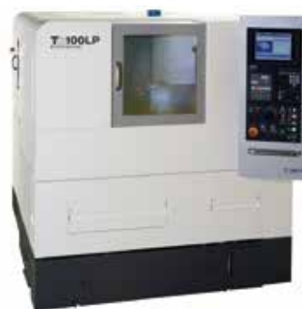
微細精密横型加工機「Th100LP」

当社が開発したBTA加工機は、1mで曲がり0.1mm以下の高精度加工が可能な真円度／面粗度に優れています。2018年から販売を開始しました。