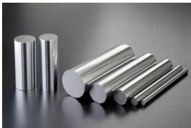
メタルソー切断された「みがき棒鋼」各種

主に空圧・油圧シリンダーロッドに使用される硬質クロムの「メッキシャフト」の切断材を全国販売しています。切断1個からご要望にお応えします。