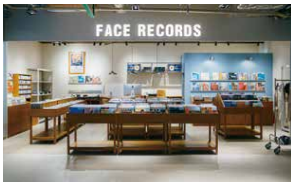
Face Records Miyashita Park 東京都渋谷区神宮前6-20-10 MIYASHITA PARK South 3F ☎ 03-6712-5645 https://www.facerecords.com/

当社では、専門のスタッフが丁寧に対応し、ご愛好者様にご納得いただけるよう丁寧に査定・買取・販売をいたします。中古レコードやCDをリユースすることにより、音楽ファンから音楽ファンへ良い循環が生まれることを目指しています。当社は「Music Go Round (音楽は巡る)」を提唱し、微力ながら循環型社会に貢献していきます。リサイクル店や遺品整理業などの法人からの査定・買取も承ります。お気軽にご相談ください。