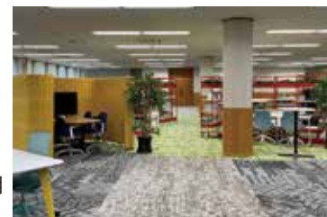
フリーアドレスを採用 した事務所