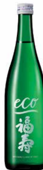
「福寿 純米酒 エコゼロ」 720ml 1500円(税別)

さらに環境負荷を軽減するため、酒米を磨く精米を80%と低く抑えるほか、醸造する工程では酵母の種類を変えることで醸造日数を7日間減らしました。